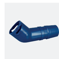
Coude 45° allongé rotatif