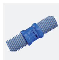
Tuyaux Twist Lock