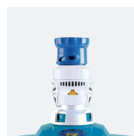
Régulateur de débit (robot)