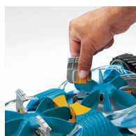
Brosses de nettoyage cyclonique