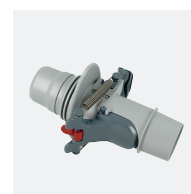
Vanne de réglage automatique de débit (skimmer)